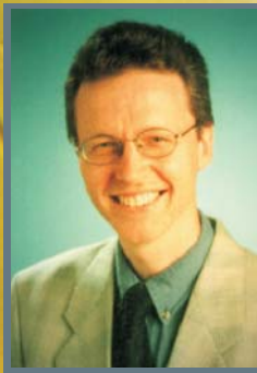
Herausgeber: Jörg Piper, Bad Bertrich

Die neue Mikroskopie-Zeitschrift in deutscher Sprache